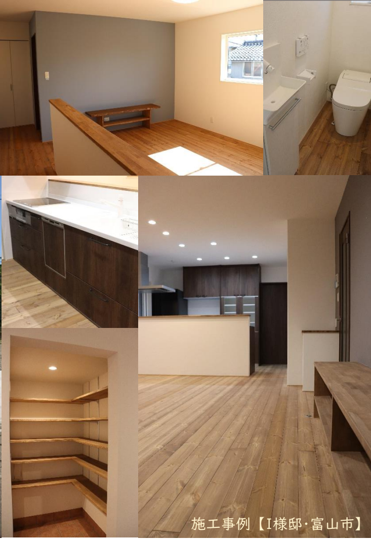
施工事例【I様邸・富山市】

〒930-2233 富山市布目1131 TEL:(050)1404-9376 FAX:(076)471-8896 MOBILE:090-4682-6228 MAIL: contact@hikage-koumuten.com URL: http://hikage-koumuten.net