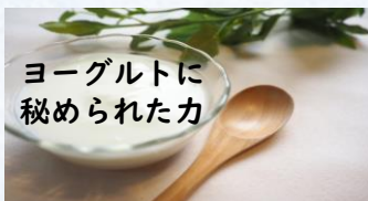
ヨーグルトに秘められた力

味噌やしょうゆ、塩麹など、健康食品として注目を集めている「発酵食品」。食品を発酵させることによってうまみが増すだけでなく、栄養価や健康促進効果を高めることができるスグレモノ。なかでも手軽に取り入れられるのが「ヨーグルト」。おやつにも朝食にもピッタリの食材です。今回はそのヨーグルトの秘められた力について調べてみました。